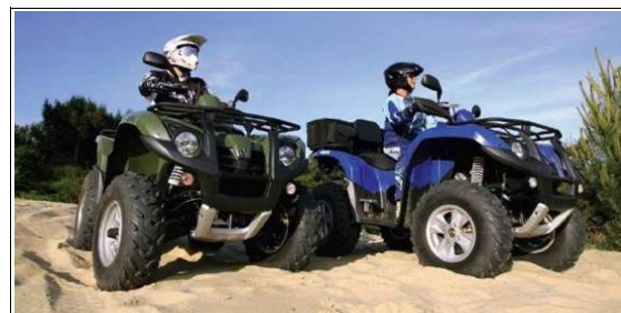
2 quads sym 600cc

Nous vous proposons de rouler sur des Quad automatiques 350cc Yamaha ou Sym 300cc et 660cc accueil – inscription administrative ( signature du règlement intérieur et dépôt de caution avec un numéro de CB : 1500 € )