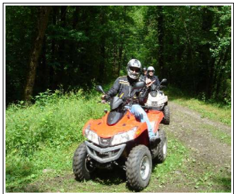
8 quads sym 300cc