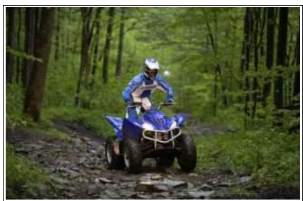
10 Quad 350cc Yamaha